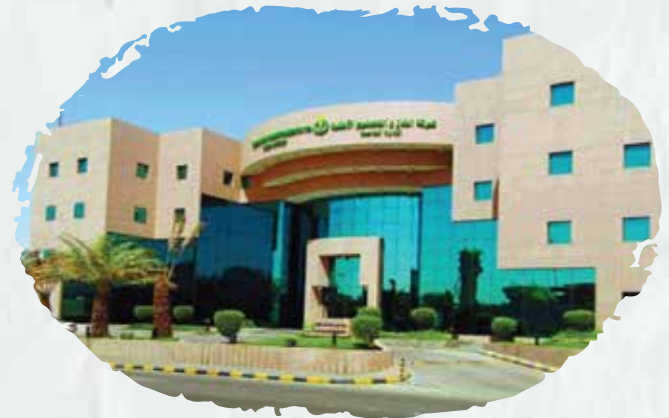
National Gas & Industrialization Company (GASCO)

We supplied and installed emergency doors, and we are carrying out the maintenance and set up for the fire alarm systems and fire pumps.