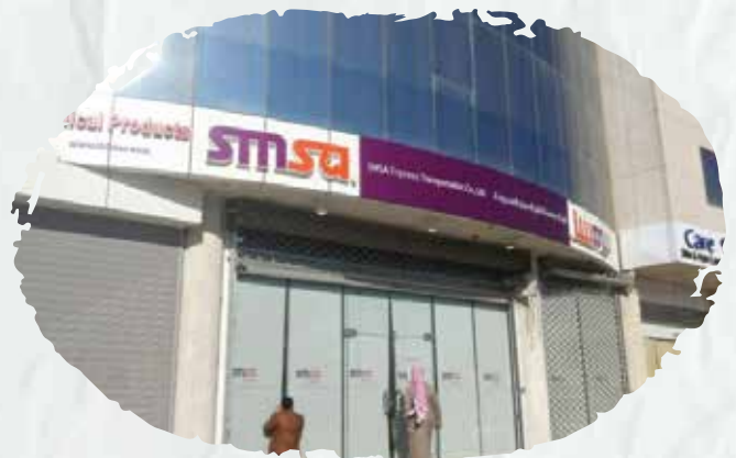
SMSA Warehouses for the Western Region and its Branches across the Kingdom

We supplied and installed the automatic spraying system, fire hose cabinets, FM200 systems, addressable and conventional systems, and performed maintenance works.