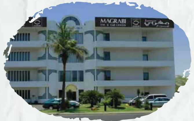
شركة مغربي للبصريات (صيانة أنظمة مكافحة الحريق وأنظمة الإنذار المبكر ضد مخاطر الحريق).