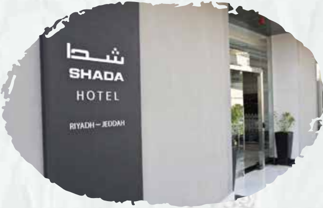
مجموعة فنادق نزل شدا للأجنحة الفندقية صيانة أنظمة مكافحة الحريق وأنظمة الإنذار المبكر ضد مخاطر الحريق.