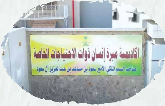
أكاديمية مبرة إنسان لصاحبها (صاحب السمو الملكي الأمير سعود بن مساعد بن عبدالعزيز آل سعود). حيث قمنا بأعمال توريد وتركيب أنظمة الرش الآلي وصناديق الحريق والتمديدات الأرضية وعساكر الحريق وأنظمة الإنذار المعنونة وأنظمة الإخلاء).