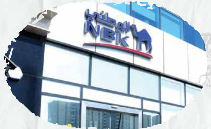
بنك الكويت (فروع جدة والدمام والرياض)

قمنا بأعمال توريد وتركيب وصيانة أنظمة السلامة بالإضافة الى عقود صيانة دورية لأنظمة السلامة بجميع أفرع جدة).