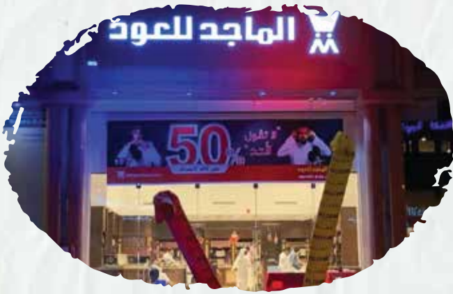
All Branches of Al Majed Oud in KSA Periodic maintenance contracts for Safety Systems in addition to filling and maintenance of all kinds of fire extinguishers.