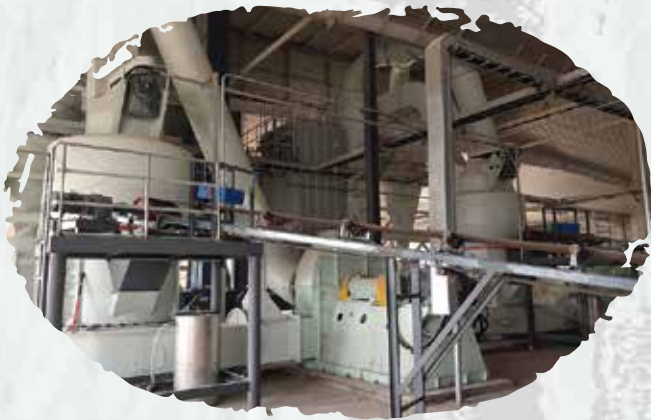
شركة المطاحن الحديثة. (عقود صيانة دورية لشبكة الإطفاء والإنذار من الحريق).