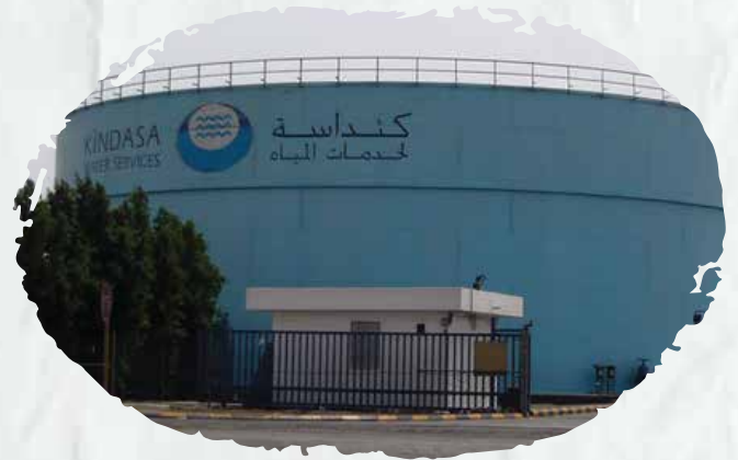
شركة كنداسة (قمنا بأعمال توريد وتركيب وصيانة أنظمة السلامة).