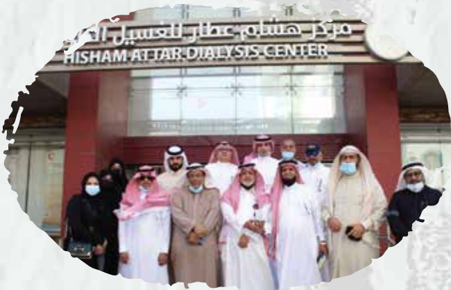
مركز هشام عطار للغسيل الكلوي (صيانة أنظمة مكافحة الحريق وأنظمة الإنذار المبكر ضد مخاطر الحريق).