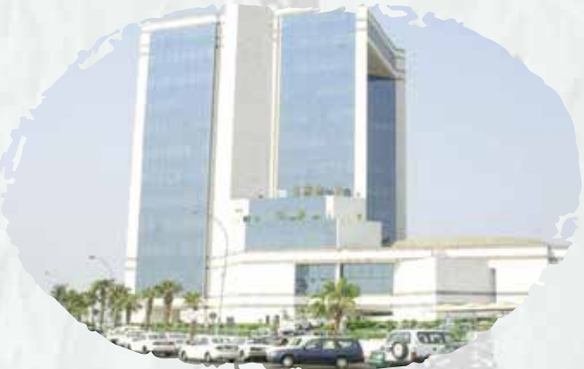
الغرفة التجارية بجدة

حيث قمنا (بأعمال تركيب الأنظمة المؤقتة للإطفاء والصيانة لعدد 65 طابقاً والمكاتب الإدارية بالبرج ونظام الإنذار بالمكاتب الإدارية بالإضافة الى عقد صيانة لأنظمة الإطفاء والاندان).