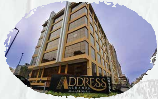
Address Al Hamra Hotel (Maintenance of firefighting systems and early warning systems against fire risks).