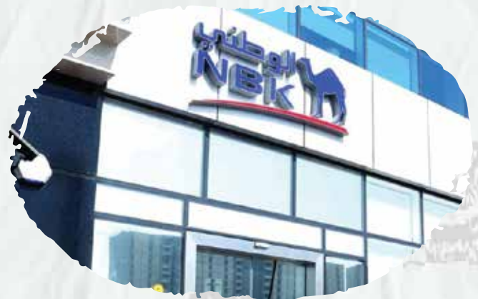
National Bank of Kuwait (Jeddah, Dammam, and Riyadh branches)

We have supplied, Installed, and maintained Safety Systems in addition to periodic maintenance contracts for Safety Systems in all branches in Jeddah.