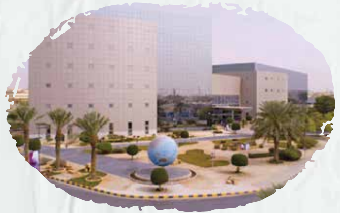
STC (18 branches throughout KSA)

We supplied and installed the automatic spraying system, fire hose cabinets, FM200 systems, addressable and conventional systems, and linking FM200 system rooms to fire alarm system, in addition to performing periodic maintenance to all their branches throughout KSA.