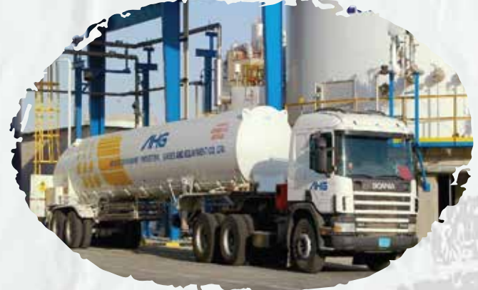
شركة عبد الله هاشم للمعدات والغازات الصناعية المحدودة صيانة أنظمة مكافحة الحريق وأنظمة الإنذار المبكر ضد مخاطر الحريق.