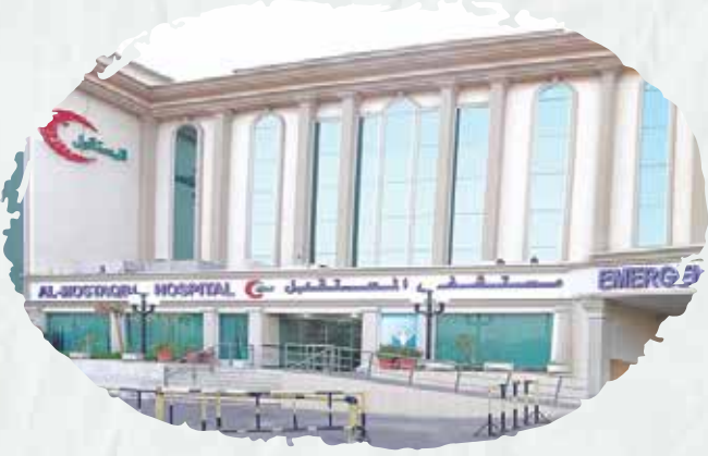
مستشفى المستقبل (صيانة أنظمة مكافحة الحريق وأنظمة الإنذار المبكر ضد مخاطر الحريق).