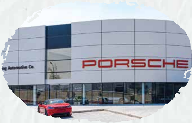
Main building of SAMACO and (16) branches throughout KSA.

We supplied and installed the automatic spraying system, fire hose cabinets, FM200 systems, addressable and conventional systems, and linking FM200 system rooms to fire alarm system, in addition to performing periodic maintenance to all their branches throughout KSA.