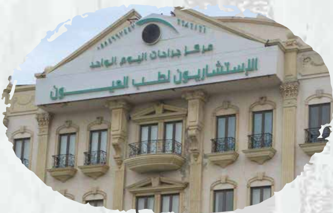
The Eye Consultant

We supplied and installed firefighting systems for hospital kitchen chimneys, in addition to carrying out the maintenance for them.