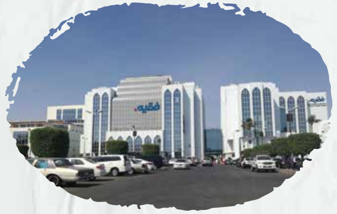
Fakeeh Hospital Supply and installation of firefighting systems and early warning systems against fire risks.