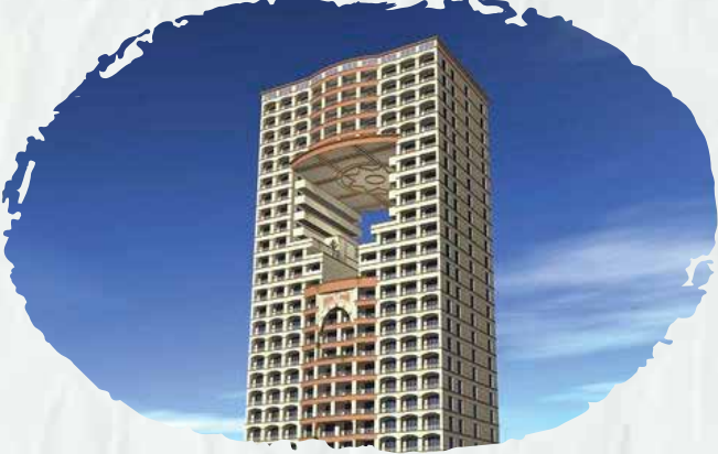
برج ديار البحر.

(قمنا بأعمال توريد وتركيب نظام الإنذار المعنون وتركيب أنظمة FM200 ومرامح الشفط).