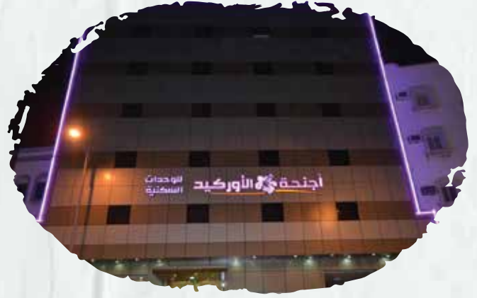
أجنحة الأوركيد صيانة أنظمة مكافحة الحريق وأنظمة الإنذار المبكر ضد مخاطر الحريق.