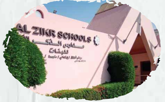
مدارس الذكر (قمنا بتوريد وتركيب أنظمة إطفاء رش آلي وأنظمة FM200 ومضخات حريق).