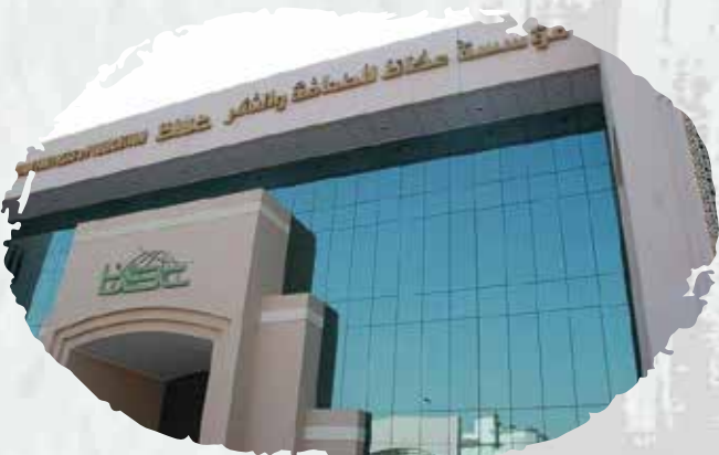
مؤسسة عكاظ للصحافة والنشر

(قمنا بأعمال الرش الآلي وصناديق الحريق وأنظمة الإنذار للفرع الرئيس بجدة، وعقود صيانة دورية لشبكة الإطفاء والإنذار من الحريق).