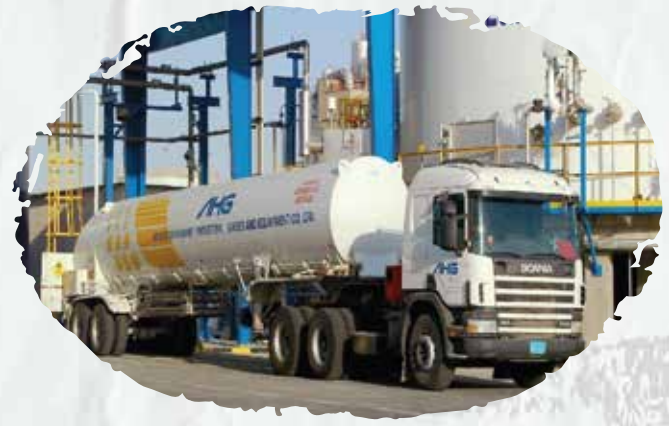
Abdullah Hashim Industrial Gases and Equipment Co. Ltd Maintenance of firefighting systems and early warning systems against fire risks.