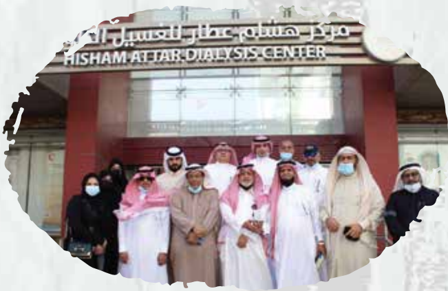
Hisham Attar dialysis center (Maintenance of firefighting systems and early warning systems against fire risks).