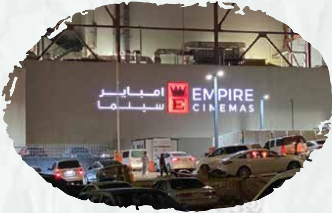
امباير سينما لأفرع مدن جده و جازان والخبر وحائل (عقود صيانة دورية لشبكة الإطفاء والإنذار من الحريق).