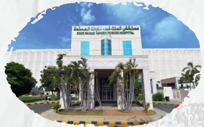
King Fahad Armed Forces Hospital

We supplied and installed the automatic spraying system, fire hose cabinets, fire pumps, FM200 system, and addressable alarm system and linking the elevator to the fire alarm system, in addition to carrying out the maintenance works for the systems.