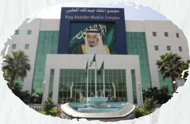
King Abdullah Medical Complex (filling and maintenance of all kinds of fire extinguishers).