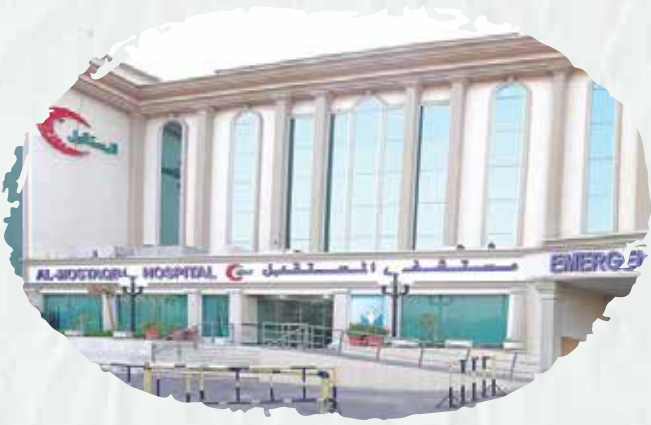
Future Hospital (Maintenance of firefighting systems and early warning systems against fire risks).