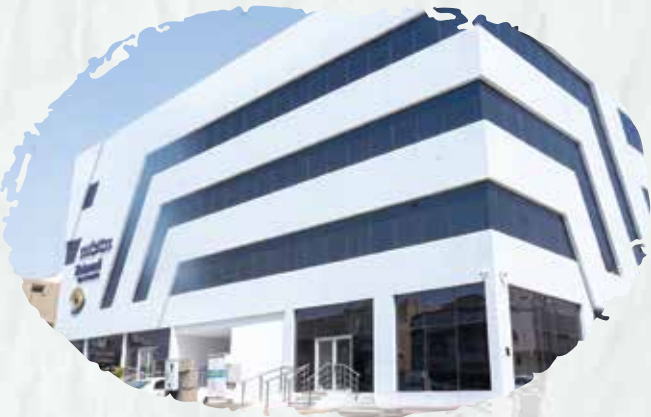
Zabeedi Eye Complex

We concluded periodic maintenance contracts for the firefighting and fire alarm systems.