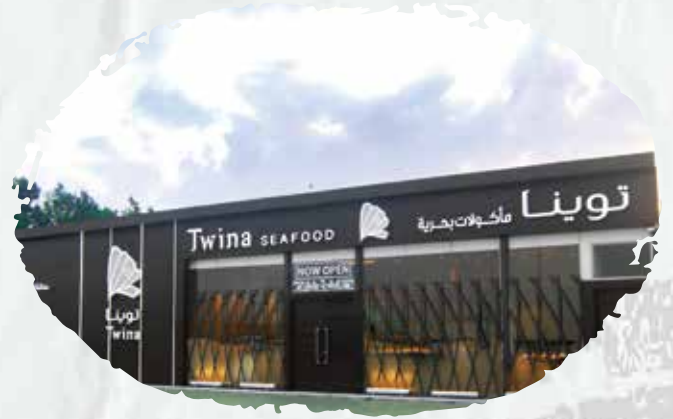
مطعم توينيا للمأكولات البحرية لأفرع جدة (عقود صيانة دورية لشبكة الإطفاء والإنذار من الحريق).