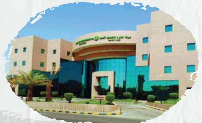
شركة الغاز والتصنيع الأهلية

(قمنا بأعمال توريد وتركيب أبواب طوارئ وصيانة وبرمجة نظام الإنذار ومضخات الحريق).