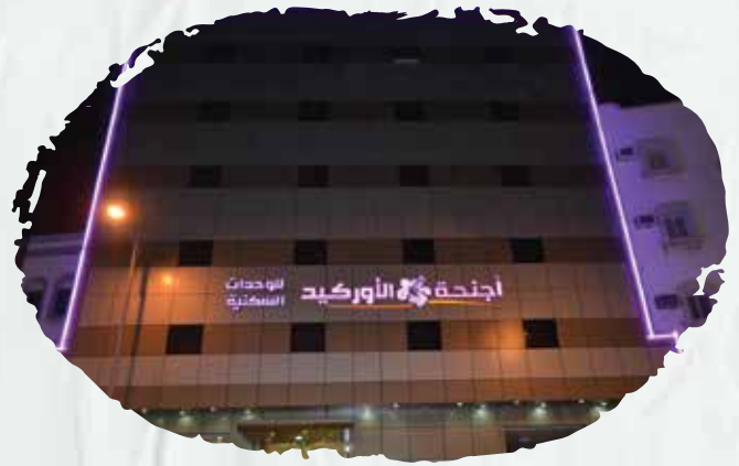
Orchid Suites Maintenance of firefighting systems and early warning systems against fire risks.