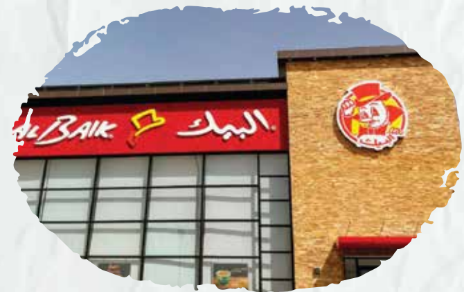
Albaik - (25) branches We performed full maintenance on all firefighting and fire alarm systems and supplied and installed an automatic spraying system, fire hose cabinets, wet chemical systems, an aerosol system, firefighting pumps, and conventional and addressable systems for a number of branches.